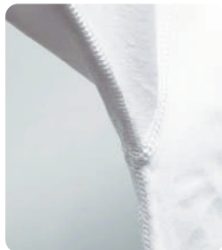
脇下部分 フラットシーマ