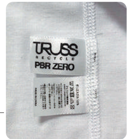
左脇内側に ブランドネームと品質表示ネーム 衿にはサイズネームのみにすることで 加工しやすく配慮しました。